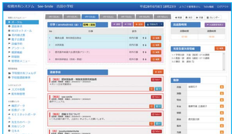
シースマイルのポータル画面

「シースマイル」の導入により、これまで連絡調整にかかっていた時間や、共有すべき情報を確認し合う時間が効率化されることで、先生方一人一人の児童生徒と向き合う時間が、これまで以上に確保されるようになることを期待しています。