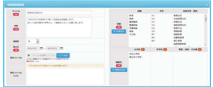
連絡事項作成画面

学校間連絡事項を利用し、教育委員会と学校間または各学校間で役職や校務分掌を指定した連絡送信を行えます。対象先は役職・学年・校務分掌・教科・学校名などのカテゴリを指定できます。送信者からは既読確認が出来ますので、メール確認の電話など手間が省けます。